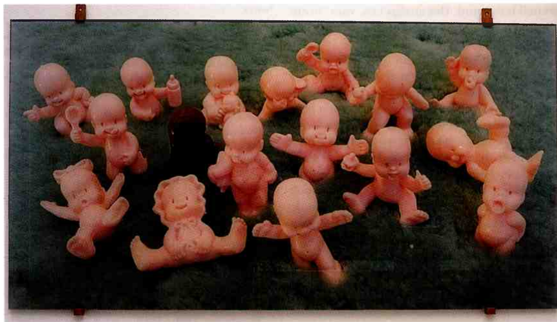
Nina Ericson, Oh, babe! , 1997.

och barn skilde sig åt i dessa båda församlingar. 20