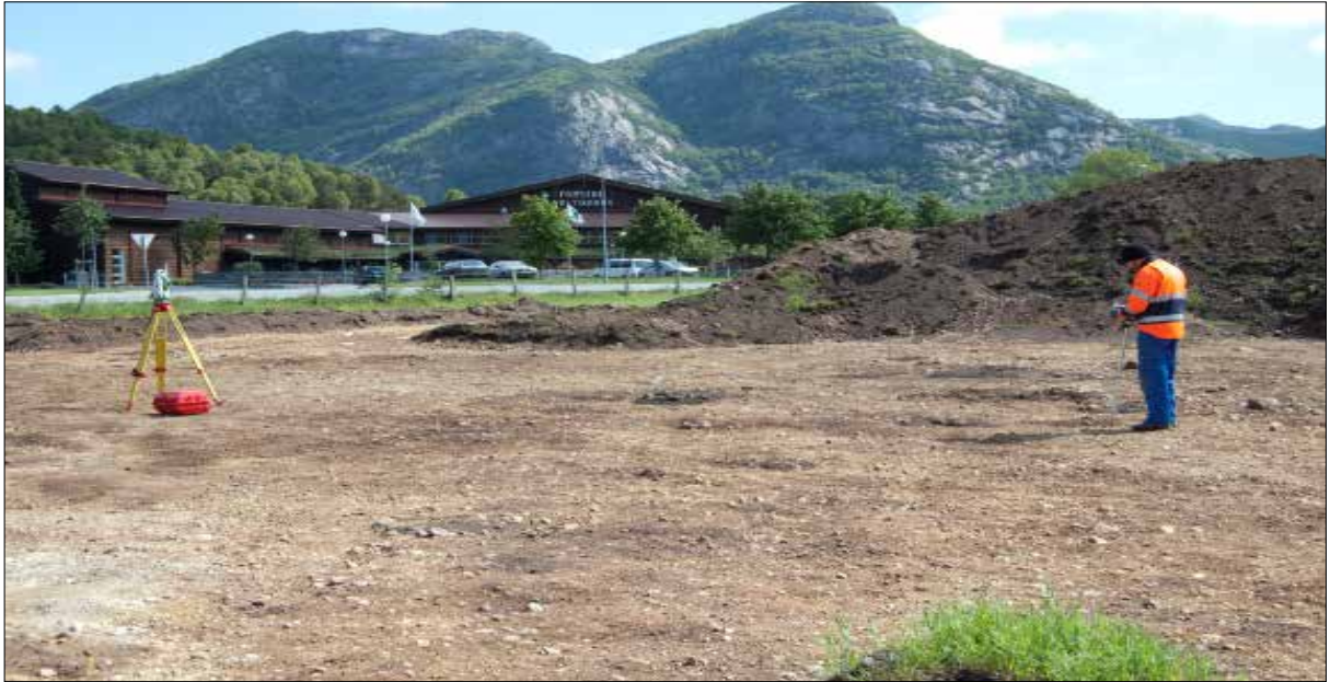
Figur 2. Innmåling til Intrasis. Forsand k, Norge.