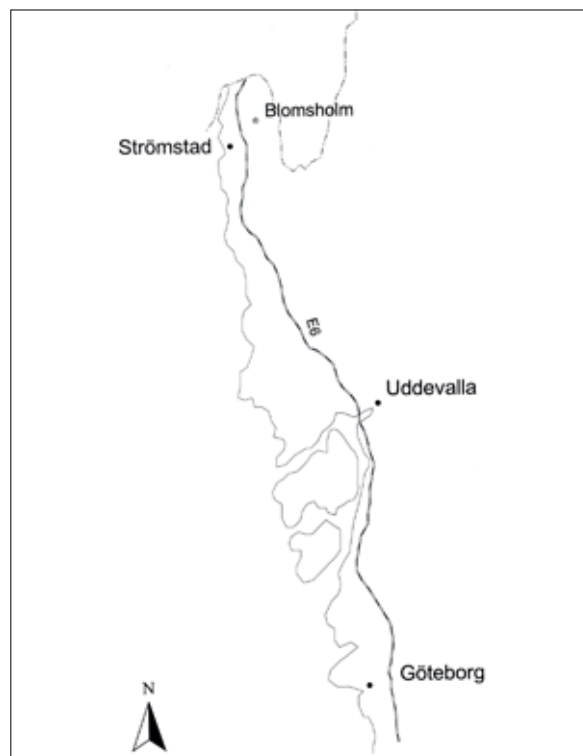
Figur 1. Undersökningsområdet Blomsholm, Bohuslän. Karta: Linda Andersson.

Under sex dagar i juli 2004 gjordes en publikundersökning vid Blomsholms gravfält. Undersökningen genomfördes som en del av projektet Kulturarv som