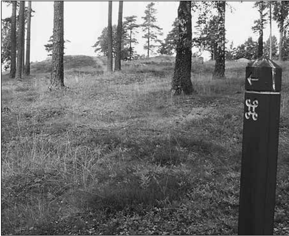
Figur 3. Styrning av allmänheten?

Mellan 1993 och 1998 utfördes det viktigaste ledet i pedagogiseringen av Blomsholm, då ett omfattande vårdprojekt genomfördes i området. Syftet var att skapa en tydligare helhetsbild av Blomsholms historiska mångfald samt att göra området mer tillgängligt för allmänheten. Man försökte på olika sätt återskapa det med fornlämningarna samtida kulturlandskapet (Kretz 1998:71, Ottander 1999:9). Detta är viktigt att ha i åtanke då föreliggande undersökning ämnar analysera beteenden vid besök på en sådan plats. Hur individen upplever landskapet och dess fornlämningar är subjektivt då det är avhängigt av dennes referensramar, erfarenheter och förkunskaper; både av det förflutna och av nuet. Det är snarare individen än det materiella som avgör utgången av mötet mellan de båda (Burström 1997:105, Hygen 1996:51). Vi hoppas genom den här undersökningen kunna närma oss detta möte.