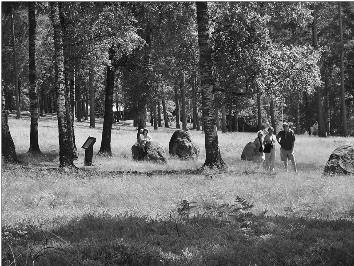
Figur 6. Blomsholmsbesökare.

de följde den utmarkerade stigen, läste på skyltarna och besökte platsen ungefär lika länge. Man gjorde vad man utifrån iscensättningen av platsen kan och kanske anser sig bör göra. Resultatet är inte helt oproblematiskt. Det tycks implicera att presentationen av Blomsholm lyckats bra med att definiera sin målgrupp och även fånga upp den. Samtidigt har det visats ovan att tidpunkten för studien troligtvis spelat stor roll för besöksgruppens sammansättning, vilket i sin tur sannolikt påverkat utfallet. Besökarna visade sig vara främst från Sverige, Norge och Tyskland. De tillhör därmed samma kulturella sfär, med i övergripande drag likartad förhistoria och förståelsehorisont Allmänheten kan således i det här fallet beskrivas som en nordeuropeisk turist. Trots att en sådan generalisering kan göras är detta sakförhållande inte helt okomplicerat. Inom denna grupp döljer sig människor med olika anledningar