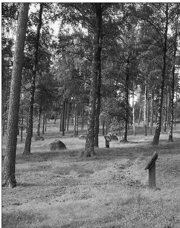
Figur 2. Stig och skyltar som vägleder besökaren runt gravfältet.

Vid Blomsholm finner man en unik miljö med bland annat Bohusläns största domarring, en av Sveriges största skeppssättningar, ett rikt varierat gravfält, storhögen Gröne Hög och det namngivande säteriet med anor från 1600-talets första hälft. Platsen för studien var det stora gravfältet med många olika gravformer såsom domarringar, högar av olika former, storhögar, flackare stensättningar samt resta stenar.